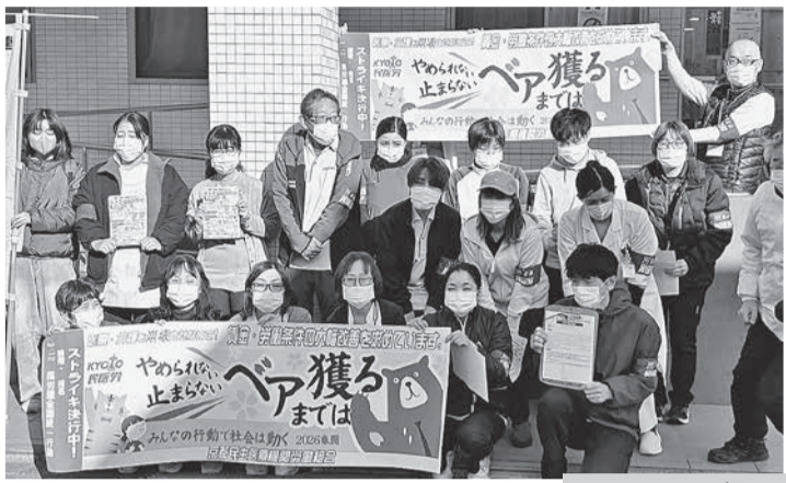
「定昇のみ」の回答に抗議し、スト決行。各事業所で30分の集会や宣伝行動を実施しました。

電話 0120-378-060 E-mail scent@labor.or.jp