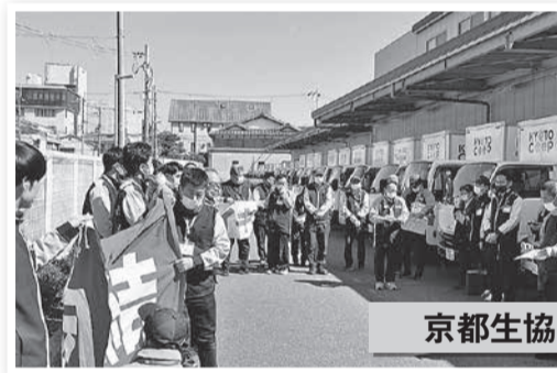
昨年の回答を大幅に下回るベア額(正規735円、パート5円)に対して抗議ストを決行。