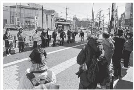
福祉に誇りを！賃金に希望を！早朝の府庁前宣伝からスタートし京都府要請。昼の白梅町宣伝から京都市要請。夜は市役所前スタートのキラキラパレードに奮闘しました。

大企業の内部留保が600兆円を超え年々増加する一方で労働分配率は低下し続けています。26春闘は、ユニオンパワーで賃上げをスローガンに、物価高騰を上回る大幅賃上げをめざして、ストライキなど多彩な行動が展開されています。