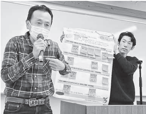
分散会での討論内容を全体共有する参加者

地区労協は府内の「地域の労働組合連合体」として各労組や地域住民の共通する要求をもとに取り組みを進めています。また、京都総評の運動を地域で具体化し、推進する役割を果たしています。コロナ禍で、地区労協全体が集まる機会が減少したため、あらためて全体で交流する場として2年前から「地区労協全体交流会議を開催しています。