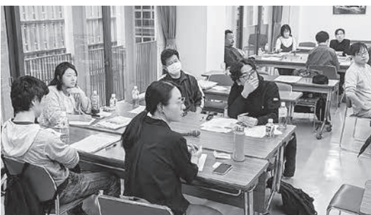
グループ討論の様子

め、自分たちの職場に持ち帰り参考にしてもらおうというもの。職場の悩みや成功例などを話し、「自分の職場でもやってみよう」「こんな方法があるのか」という新たな発見や励みになっていきます。参加者からは「いろいろな職場の話が聞けるのはいい」との感想もあります。討論だけでは