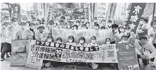
25秋闘11・6統一行動 医労連アクション

療報酬制 適正な診療報酬に 金上昇に 対応した 前の宣伝とサウンドデモで市民にアピールしました。 従事者の人件費増、診療報酬制度の問題などがあ ります。 国の財政支援や物価・賃金上昇に 対応した 前の宣伝とサウンドデモで市民にアピールしました。