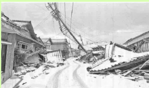
あたり一面の家屋が倒壊 (『京都自治労連2007号』より)