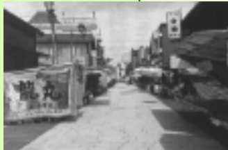
地震前の輪島朝市風景