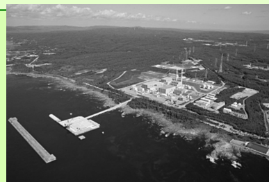
志賀原発全景