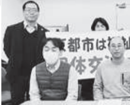
判決後に記者会見する原告と弁護団

福祉保育労との団体交渉を京都市が突然拒否し、福祉保育労が京都府労働委員会に不当労働行為の救済申立を行いました。そして、京都府労働委員会が昨年6月1日に「京都市は福祉保育労との団体交渉に応ずること」という救済命令を出しましたが、それ以降も京都市が団交拒否を続けているため、組合が損害を被っているとして損害賠償請求訴訟を提訴してたたかってきたものです。