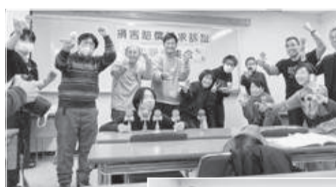
▲みんなでケン玉をして団結示す