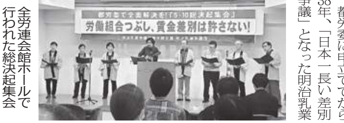
全労連会館ホールで行われた総決起集会