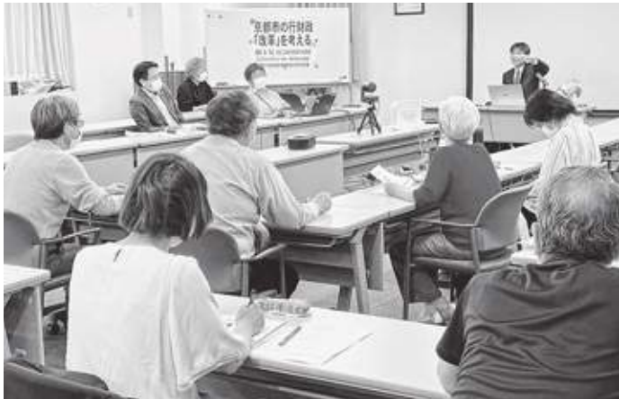
熱心に講演を聞く参加者