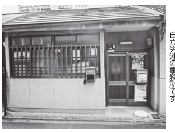
自立労連の事務所です