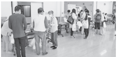
133人が来場されました

加盟単組と地域の民主団体が構成する実行委員会を3月より5回開催し、5月22日天候に恵まれるなか、「うじ食糧支援プロジェクト」を開催しました。開始10分前には予定食数の半分を超える整理券を配布。133人の来場者