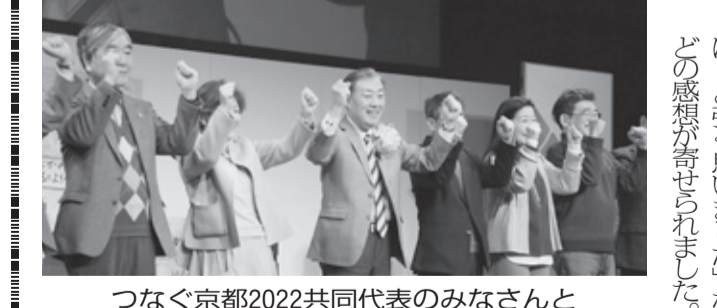
つなぐ京都2022共同代表のみなさんと