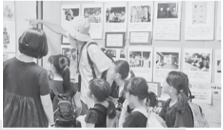
先生の説明に聞き入る子どもたち