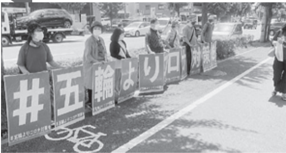
7月23日いのちを守る緊急行動

京都総評第91回定期大会を9月4日（土）に京都教育文化センターで開催します。コロナ禍のもと、感染拡大防止の観点から時間を短縮し、午後からの開催となります。コロナ禍を迎えた昨年の大会から一年、組合活動をすすめていくうえで、新たな一年の運動方針を確立する大会です。