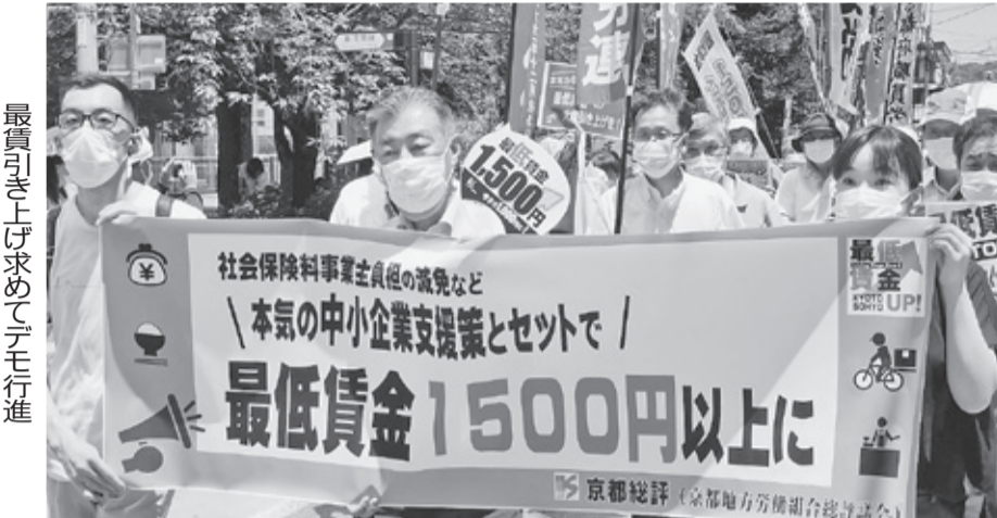
最賃引き上げ求めてデモ行進