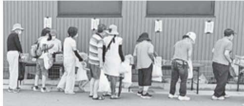
女性の参加が目立ちました

8月1日に西京食料提供の取り組みが行われ、300人の参加がありました。若い女性の姿も多くみられ、腰を押さえないながら「医療の相談を受けたい」と言われる方や、双子の子どもを連れ