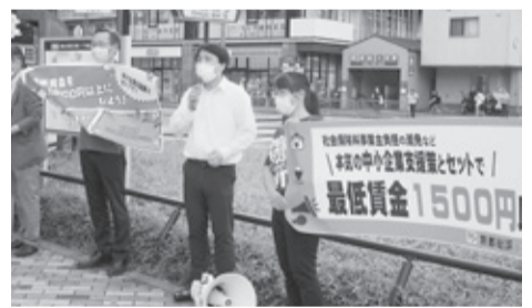
四条大宮で街頭宣伝

議会の役割発揮を求めました。「最賃生活体験」を行った総評青年部からは「生活体験には『終わり』があるから耐えられた」「最賃では普通の暮らしができません。大幅引き上げを」と迫りました。京都パート非常勤ネットワークからは、パート労働者の生活実態を告発し、最賃の引き上げは待たない」と強調しました。