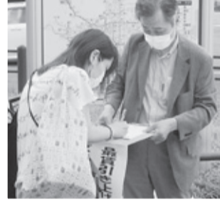
次々と署名が集まります