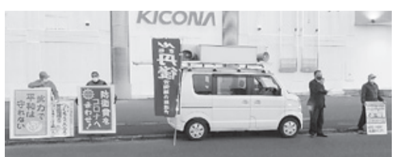
「労働相談受付中」と宣伝

京都府の最北端、京丹後市内の労働組合で組織する丹後労働組合総連合(略称・丹労連)です。新型コロナウイルス感染症の拡大により、丹労連傘下の、官・民それぞれの労働組合は、その影響を受けている労働者は、それぞれ丹労連