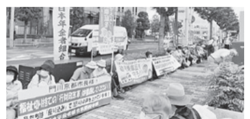
猛暑の中、座り込みでアピール

京都市は財政危機を理由に、財政危機を招いた原因や責任を明確にしないまま歳出カットが必要だとして、敬老乗車証の見直し(改悪)をはじめ、市民サービスとの切捨て、市民負担増などの「行財政改革」をすすめるようとしています。年金者組合は「市民の宝、敬老乗車証制度を守れ」と運動をすすめて、7月19日には猛暑の中、京都市役所前で座り込み行動をのべ80人を超える参加で行い、市職員や通行人にプラカードや横断幕で「敬老乗車証を守れ」とアピールし「市民の宝である敬老乗車証の現行制度を維持してください」と訴えました。