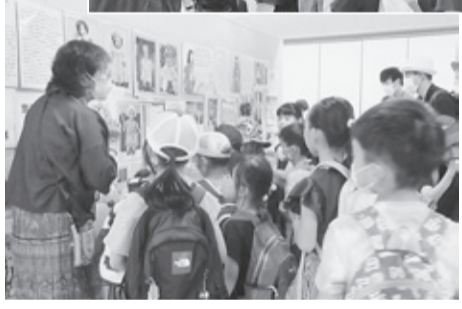
青い目の人形の展示を見えています

1981年7月に第1回戦争展が行われてから40年の今年、第41回平和のための京都の戦争展が京都市教育文化センターで行われ、2日間で750人が参加・観覧しました。講演会やピアノ弾き語り、朱雀第3児童館の子どもたちの「ロックンロール」などの文化企画、実行委員会参加団体が工夫を凝らした展示企画など盛りだくさんの内容です。先生といっしょに参加した学童保育の子どもたちは、説明を聞きながら真剣な眼差しで展示をみており、平和の大切さを感じているようでした。40年の歴史を踏まえて、子どもたちや若い人たちに戦争展を通じて平和の問題を考える機会として、いっそう発展させていくことが期待されます。