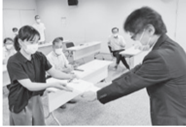
労働局に最賃署名を提出

7月19日に、70人が参加してデモで最賃引き上げをアピールし、京都労働局に7526筆の署名を提出しました。