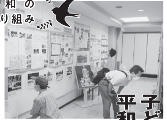
食い入るように展示を見る参加者