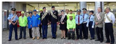
・写真は、いずれも14th missile defense battery face book より。

米兵による住民に交通安全を呼びかけるキャンペーンがスーパー前で行われましたが、自らの部隊への再徹底こそ必要ではないでしょうか。