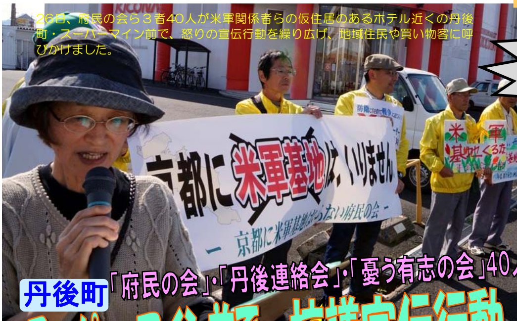
丹後町「府民の会」・「丹後連絡会」・「憂う有志の会」40人