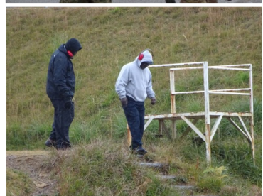
十一月二十九日、陸上自衛隊福知山駐屯地射撃場での米軍と軍属

青森車力基地の軍属が日本人女性に暴行 29日三沢基地で発生したもので、軍属は憲兵に捕まりました。