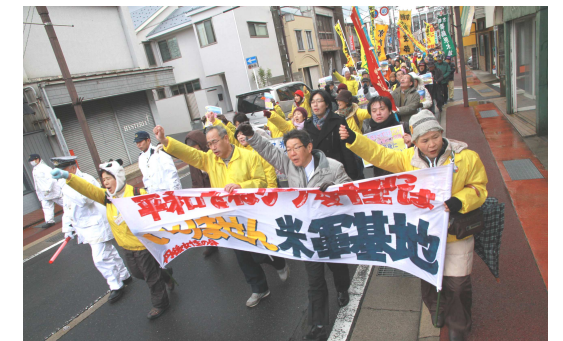
2013年12月15日峰山での米軍基地設置に反対するデモ

日本環境管理基準（JEGS）にもとづく事前の環境評価問題で、在日米陸軍司令部（神奈川県座間市・キャンプ座間）は、「日本政府の情報に基づき、自然・文化的遺産の現地調査は必要ないと判断された」（京都新聞8月28日付）と答えています。米軍基地が設置される場所は、住居が近接し、国定公園内で山陰ジオパークに指定されています。政府・防衛省は、「JEGSは米軍の責任で実施されるもの。地域の実情は米軍に伝えてあり、きちんと対応されると思う」（6月6日府民の会防衛省交渉）と答えていました。ところが、日本政府のアドバイスによって、米軍がまともな調査をしなかったことが明らかとなりました。