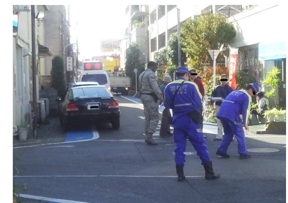
2012年11月、横田基地近くで起こった米軍関係者（Yナンバー車）による自動車事故の現場