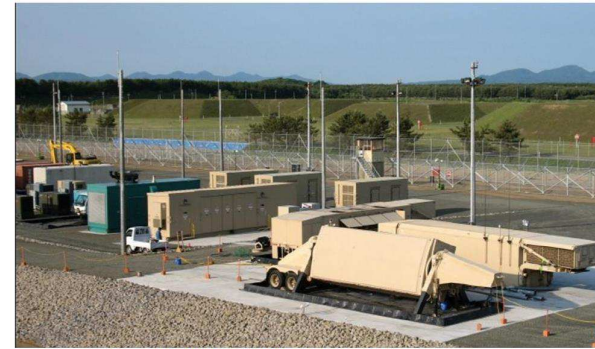
Figure 1-3. AN/TPY-2 (FBM) with Essential Support Equipment

写真は、Xバンドレーダー（AN/TPY-2）の装置一式（移動式）で、一番手前がレーダーです。他に制御装置、冷却装置などです。このレーダーは、1000キロ先の野球のボールほどの大きさの物体を見分けることができます。