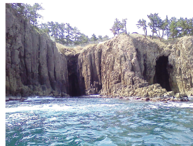
写真上：米軍基地建設で「穴文殊」一帯が破壊された。松の木も伐採。写真下：海食洞の真上に米軍基地がつくられる。

そもそも米国領土へ行くミサイルを探知することを目的とした経ヶ岬の米軍基地は、「相手国」から必然的にターゲットなり、テロの対象ともなりますが、この発言で、地域の危険性は格段に増します。