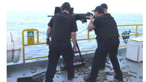
重機関銃で射撃訓練中のシュネガ社員たち

強い電磁波のため、半径6キロ高度6キロが飛行禁止となりますが、地域の救急医療にとって不可欠なドクターヘリの運行に支障をきたします。防衛省は、すでに設置している青森県車力での例をあげ「事故（海難者捜索）の時は停波（レーダーの電波を止めること）してきた」（住民への説明）としていました。ところが、米軍は「停波した記録はない」（京都新聞8月28日付）と回答し、今後も停波するかどうか明確にしませんでした。