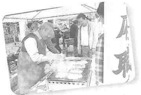
東北の被災地でも大好評だった一銭洋食

バンド演奏も盛り上がりました。舞台では争議をたたかう仲間、通信労組・ダニー・ボーイズ、全厚生合唱団などが思いをつづった自作の歌を披露しました。また