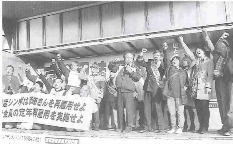
すべての争議に勝つぞ!

11月18日、京都市南区にある六孫王神社で「京都団結交流まつり」を開催しました。