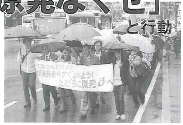
11・11関電京都支店包囲デモ

京都支店前までデモを実施。午後7時から始まった関電京都支店前のスタンディングアピール、京都原発ゼロネットの街頭演説会、午後3時30分に出発したデモなどの一連の行動には750人が参加。デモにははたらく女性の中央集会の参加者も合流。雨の中、市民に「原発なくせ」「原発とめろ」と訴えました。