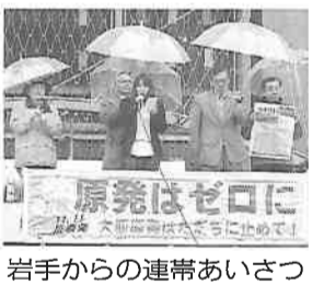
岩手からの連帯あいさつ

11月11日、首都圏反原発連合が都内9ヶ所での大規模な大占拠抗議行動を実施。雨の中、約10万人が参加しました。この大占拠抗議行動に呼応し、京都府内各地で行動が実施されました。府内15ヶ所でデモやアピール行動、宣伝行動が行われました。京都自治労連は中京区の公園から約70人が、京建労は京建本部近くから約100人が、関電