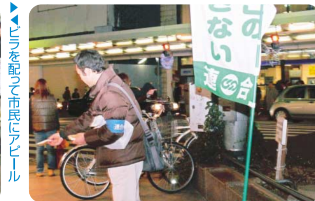
▲ティッシュを配る市民にアピール