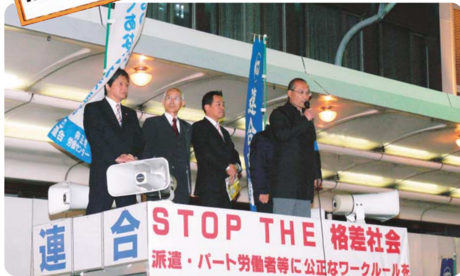
▲格差是正について力強く訴える安宅会長代理