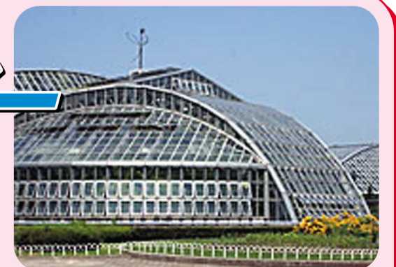
▲来年の会場となる府立植物園

[連合京都ホームページアドレス] http://www.labor.or.jp/rengo/