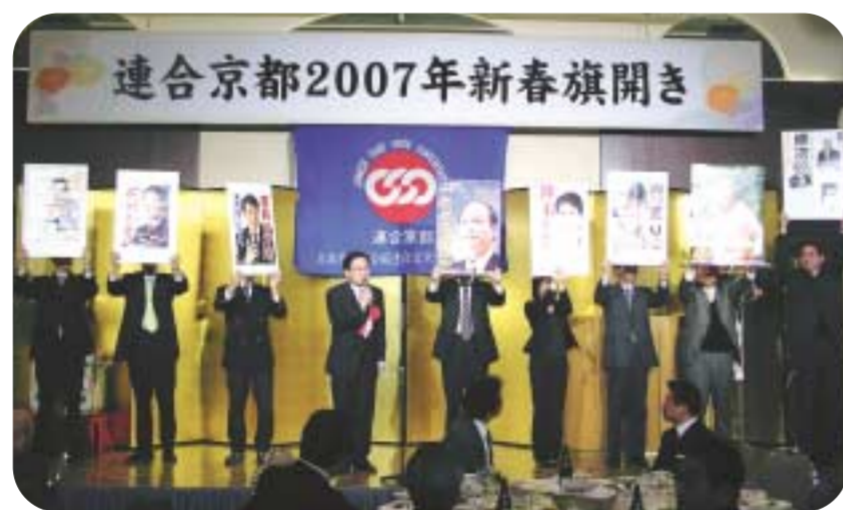
▶比例8候補のポスターと並んで決意を語る松井参議院議員