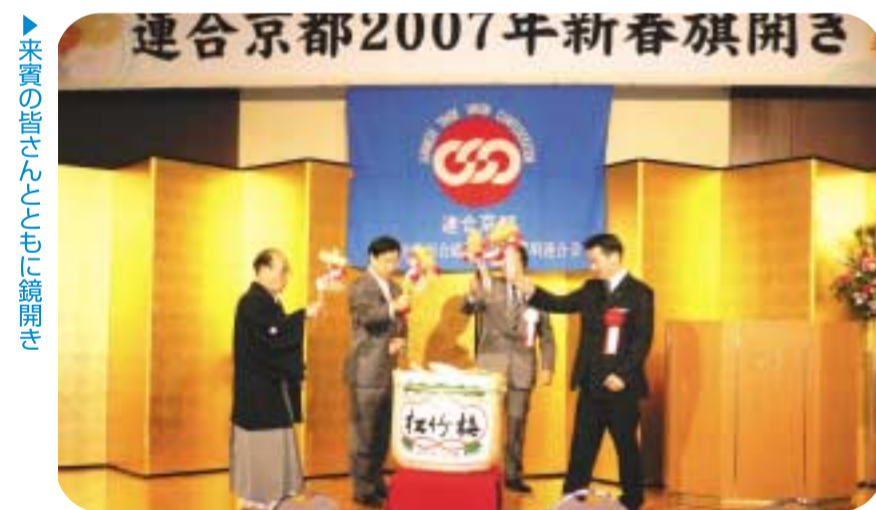
▶来賓の皆さんとともに旗開き