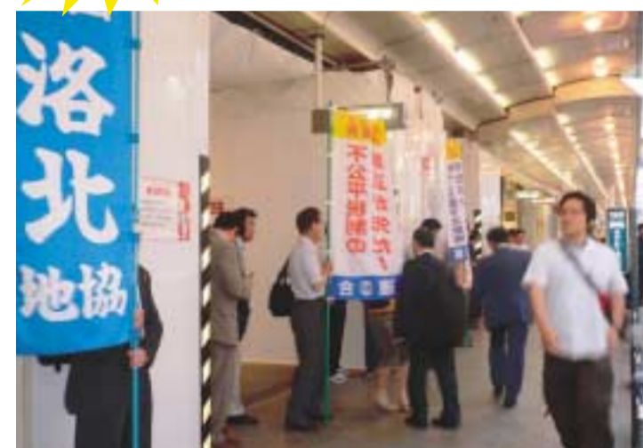
▲四条河原町でピラやティッシュを配り市民にアピール