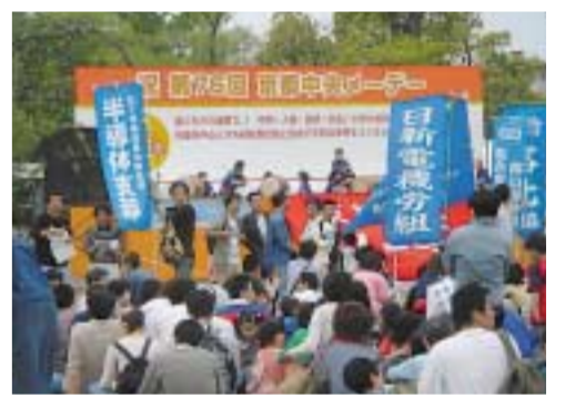
▲ 昨年の京都中央メーデー