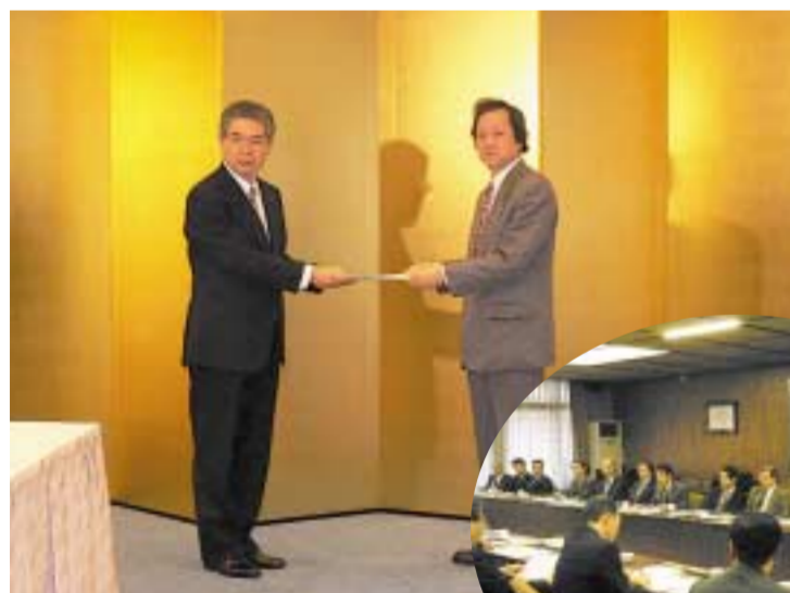
▲大宮京経協会長へ要請書を手渡す(2/20)

京都経営者協会・商工会議所・中小企業団体中央会・労働局などに対し、賃金カーブを維持したうえでの賃金引き上げ、パート労働者の賃上げ、均等待遇の実現など格差社会に歯止めをかけ生活向上に寄与する本物の景気回復めざすため、各企業への指導と政策・制度改善を求めて要請行動を行った。