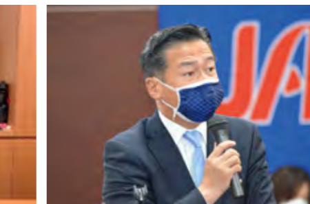
立憲民主党京都府総支部連合会 参議院議員 福山 哲朗氏