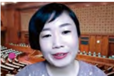
準組織内議員 参議院議員 村田きょうこ氏