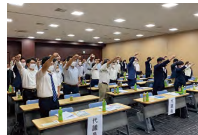
2023年度の活動に一致団結して がんばろう 三唱