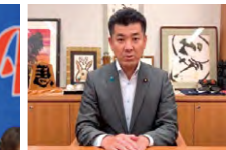
立憲民主党党首 衆議院議員 泉 健太氏