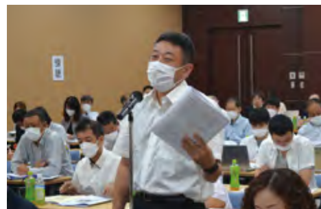
松本代議員(シンボ労組)