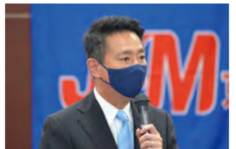
国民民主党京都府総支部連合会 衆議院議員 前原 誠司氏