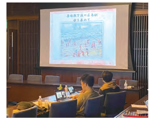
7月11日 青年協議会サマーセミナー 広島被爆者体験者の講話 / 謎解きクイズ