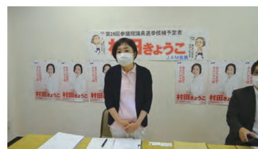
6月15日 京都府連絡会 Web意見交換会