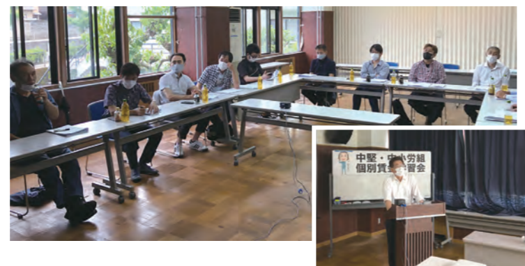
6月26日 中小労組対策委員会 「中堅・中小労組 個別賃金学習会」