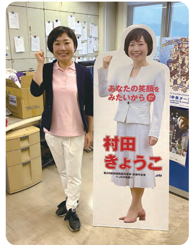
JAM京滋事務所に表敬訪問