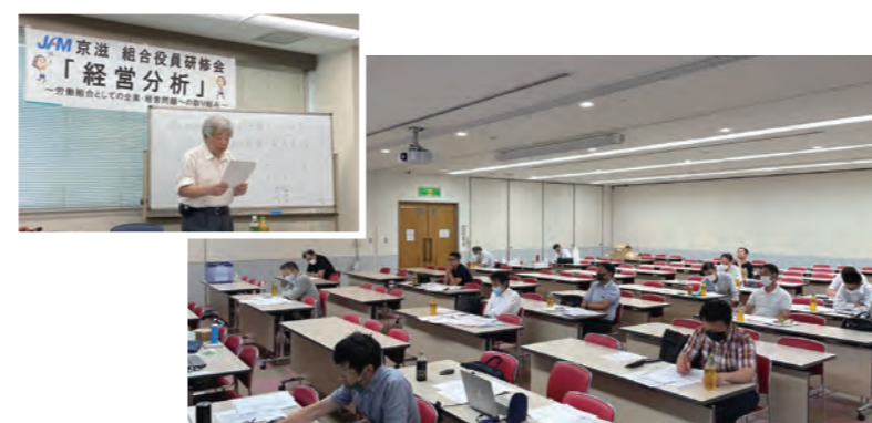
7月3日 組織・財政委員会 組合役員研修会「経営分析」