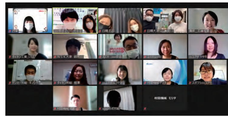
7月3日 女性協議会 「働きながら子育てする人のための仕事復帰に向けた準備」