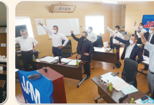
北部地区協議会 日進製作所労働組合