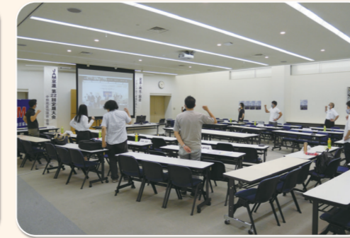
中部地区協議会 島津労働組合SUN21