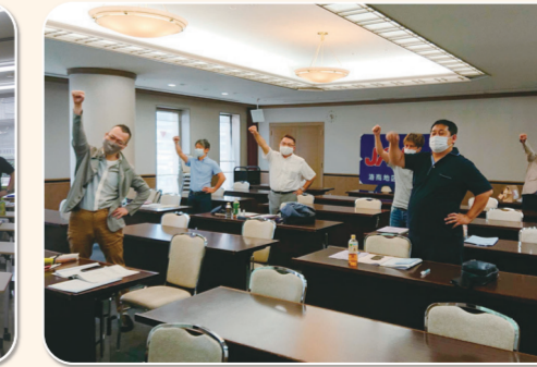
洛南地区協議会 京都テルサ