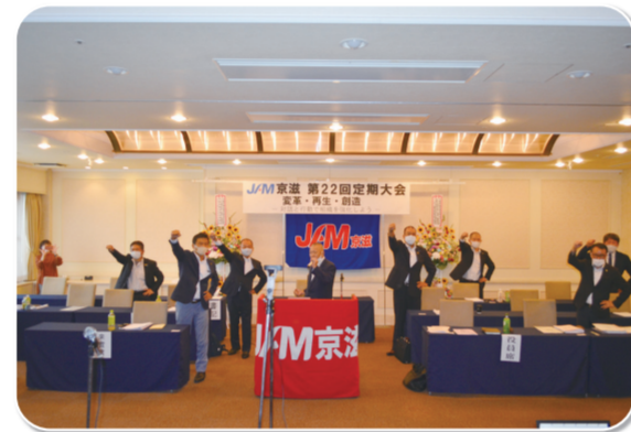
一致団結して ガンバロー