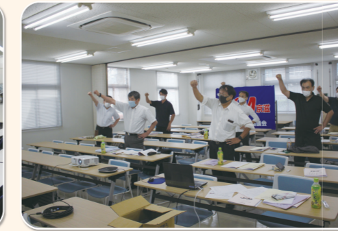
南・乙訓地区協議会 ジーエス・ユアサ労働組合