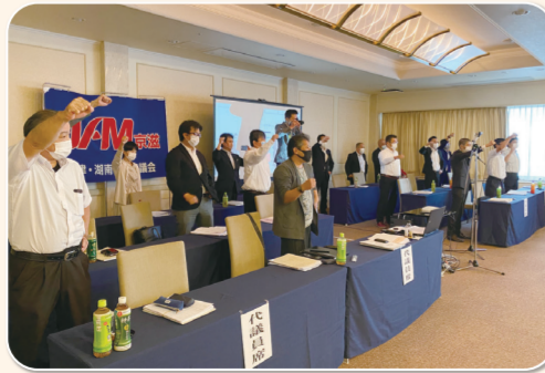
大津・湖南地区協議会 琵琶湖グランドホテル