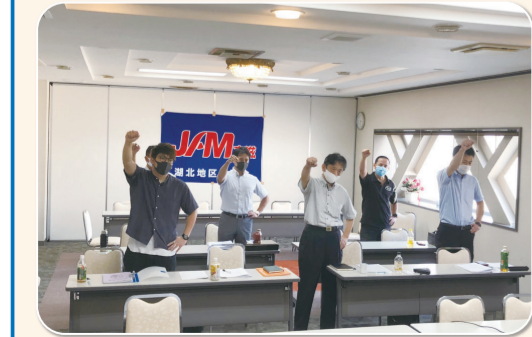
湖北地区協議会 彦根労働福祉会館