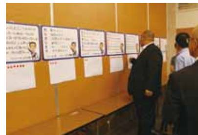
TANAボードコンテスト投票風景