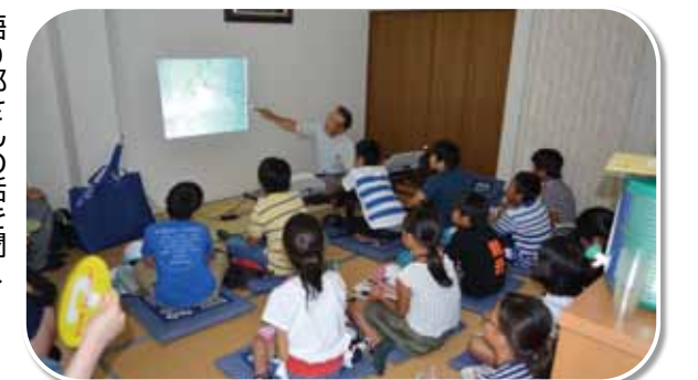
語り部さんの話を聞く子どもたち