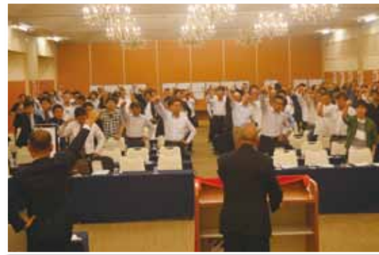
全員で団結ガンバロー!!