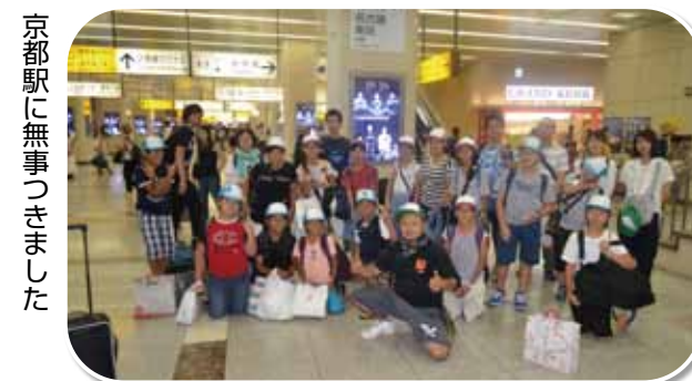
京都駅に無事つききました

今年も元気に15名（JAM京滋14名・一般京都1名）が、8月5日から2日間にわたって「ヒロシマ」を体験し、学習しました。JAM京滋は平和を守る取り組みとして、1981年より毎年8月5日・6日の両日、組合員の子弟を広島へ派遣し、戦争の悲惨さを知らないではなく、知ることから始める平和希求の活動として「子ども平和ヒロシマ体験学習」を毎年行なっています。「子ども平和ヒロシマ体験学習」では5日に語り部さんから原爆体験談を聞き、平和公園にある原爆被害資料館を見学し、6日は平和記念式典に出席して、組合員の子供たちが世界平和を考える機会としています。