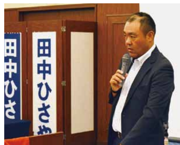
春闘中間総括の提案を行う青山労働政策委員長