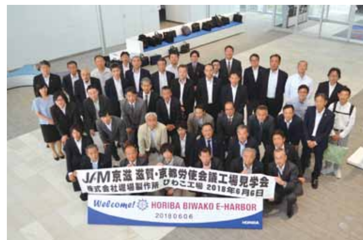
堀場製作所びわこ工場を労使で見学 (労使会議工場見学会6/6)