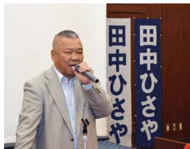
主催者代表挨拶を行う勤本執行委員長