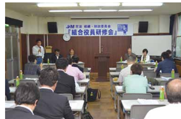
社会保険労務士による社会保険の講義とブラック社労士問題を学習 (組合役員研修会5/13)