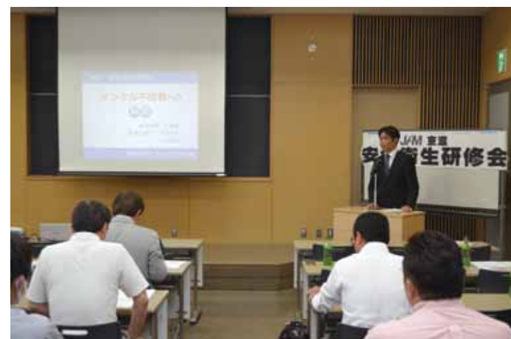
職場のメンタルケアについて長岡病院から講師を招いて学習 (安全衛生研修会5/11)