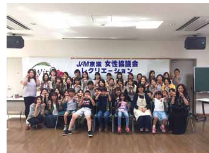
レジンでキーホルダー作りを体験 (女性協レクリエーション5/26)