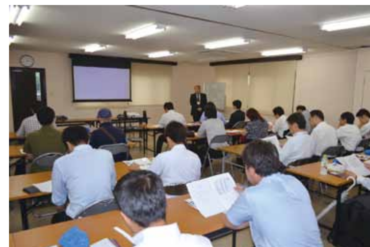
齊藤酒造を工場見学・安全に関する意見交換 (安全衛生交流集会6/8)