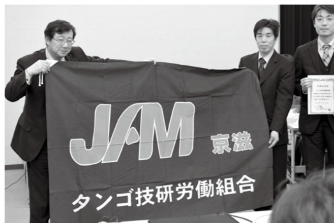
JAM京滋の新しい仲間 タンゴ技研労組