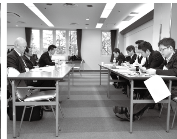
模擬団交 経営者、労働組合とわかれて本番さながらの交渉