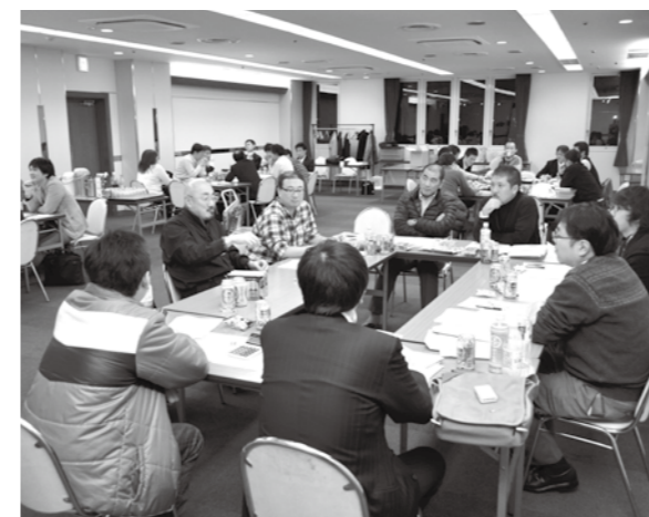
グループ討議 夜遅くに及んだ要求討議

2日目は、模擬団交を行い、各グループともベア要求に至った説明と回答引き出しに本番さながらの交渉となった。