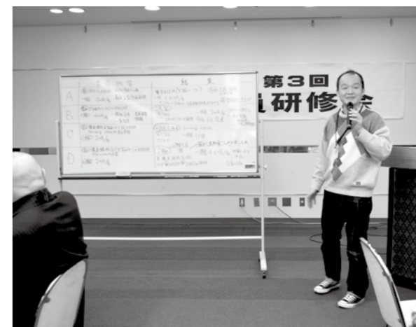
模擬団交の結果発表