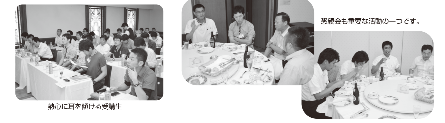
熱心に耳を傾ける受講生